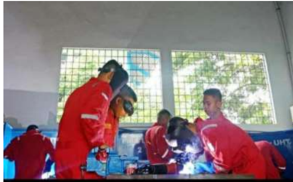
Gambar 3. Pengelasan dengan posisi down hand

Jika semuanya telah siap maka dilanjutkan dengan pengelasan specimen tersebut. Pengelasan dimulai dengan pengelasan titik dilanjutkan dengan pengelasan dengan gerak melingkar. Semuanya dilakukan dengan posisi down hand (posisi bawah tangan) seperti ditampilkan pada gambar berikut.