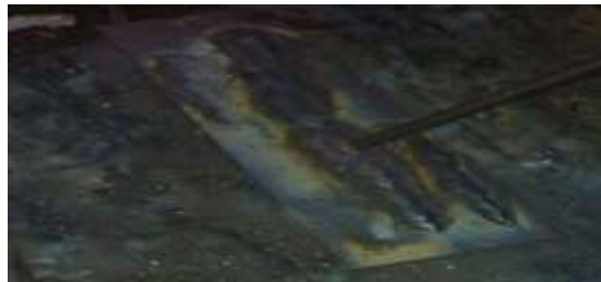
Gambar 4. Hasil pengelasan

Selanjutnya yang terakhir Pembersihan terak las dan pemeriksaan hasil lasan secara visual ( manual ). Bersihkan terak las menggunakan palu dan sikat untuk dapat melihat secara jelas hasil las. Amati hasil las secara visual. Hasil pengelasan dapat dilihat pada gambar berikut.