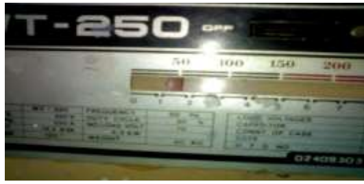
Gambar 2. Besar arus yang digunakan

Jika semuanya telah siap maka dilanjutkan dengan pengelasan specimen tersebut. Pengelasan dimulai dengan pengelasan titik dilanjutkan dengan pengelasan dengan gerak melingkar. Semuanya dilakukan dengan posisi down hand (posisi bawah tangan) seperti ditampilkan pada gambar berikut.