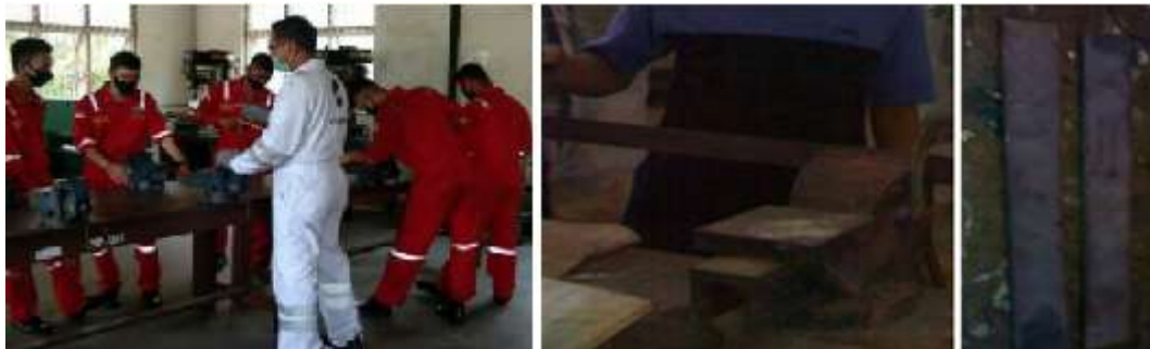
Gambar 1. Pebuatan specimen

Pembuatan specimen dan pemeriksqaan kesiapan alat/perkakas las. Bahan specimen dari besi strip ukran 2900 mm x 20mm x 4mm. Sebelum dilakukan latihan pengelasan specimen dibersihkan menggunakan amplas dan disikat agar debu yang menempel hilang. Pembuatan specimen dapat dilihat pada gambar berikut