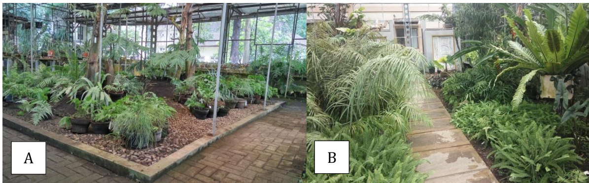
Gambar 1. Lokasi pengamatan koleksi tumbuhan paku KR Purwodadi, (A) rumah kaca V dan (B) rumah kaca VI