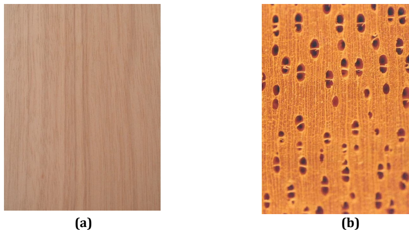
Gambar 2. Struktur makro kayu jabon merah ( A. macrophyllus ): penampang tangensial (a) dan struktur makro penampang melintang, perbesaran 10x (b)

\mu\text{m} ). Ceruk antar pembuluh berumbai, ceruk antar pembuluh dan jari-jari dengan halaman yang sempit, serupa dalam ukuran dan bentuk dengan ceruk antar pembuluh. Parenkim aksial apotrakea tersebar dan tersebar dalam kelompok. Tipe sel parenkim aksial lebih dari 8 sel per untai. Jari-jari terdiri atas 2 ukuran yang jelas. Jari-jari kecil 1-3 seri dan jari-jari besar umumnya 4-10 seri. Komposisi sel jari-jari dengan 1 jalur sel tegak dan atau sel bujur sangkar marjinal. Frekwensi jari-jari 12 atau lebih per mm. Serat dengan ceruk berhalaman yang jelas, serat tanpa sekat dijumpai. Panjang serat 2.108,07 \pm 263,72 \mu\text{m} , diameter serat 38,46 \pm 3,71 \mu\text{m} , diameter lumen serat 29,21 \pm 4,12 \mu\text{m} , tebal dinding serat 4,63 \pm 0,88 \mu\text{m} . Kayu jabon merah dan mangium merupakan jenis pohon cepat tumbuh. Jika dimensi serat kayu jabon merah dibandingkan dengan mangium yang memiliki berat jenis 0,48, panjang serat 782,4 \mu\text{m} , diameter serat 21,7 \mu\text{m} , diameter lumen 16,3 \mu\text{m} dan tebal dinding 2,8 \mu\text{m} (Prabawa, 2005) maka kayu jabon merah memiliki panjang serat, diameter serat, diameter lumen dan tebal dinding lebih tinggi daripada kayu mangium. Struktur makro dan mikro anatomi kayu jabon merah disajikan pada Gambar 2 dan 3.