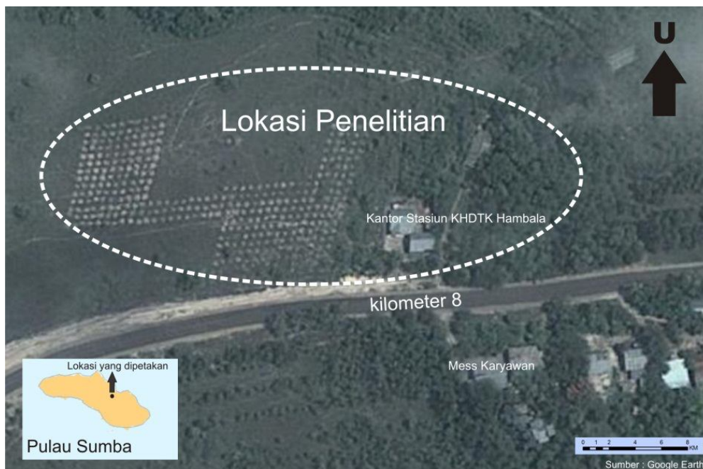
Gambar 1. Lokasi penelitian di KHDTK Hambala Figure 1. Research location in KHDTK Hambala

Penelitian dilakukan di KHDTK Hambala, Kota Waingapu, Kabupaten Sumba Timur, Provinsi NTT pada bulan Desember 2012. Lokasi penelitian berada pada ketinggian 150 m dpl, topografi bergelombang dengan dominasi savana di bagian puncak dan tegakan alami di bagian cekungan, curah hujan rata-rata 866,26 mm/tahun, jumlah hari hujan 90 hari/tahun. Temperatur maksimal 28,44°C, minimum 22,73°C dengan kelembaban nisbi rata-rata 77,17%.