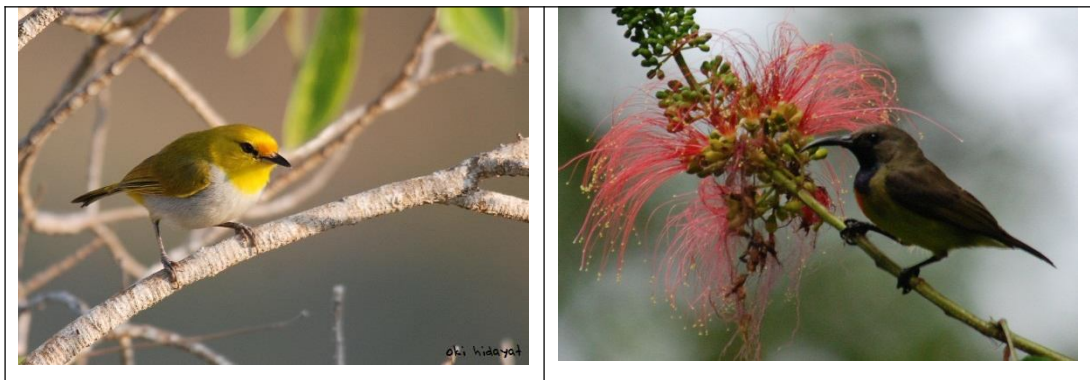
Gambar 4. Kiri : Kacamata wallacea; Kanan : Burung-madu sumba Figure 4. Left : Yellow-spectacled white-eye ; Right : Apricot-breasted Sunbird

mata berwarna kemerahan. Menghuni daerah semak-semak kering, rumpun tumbuhan rimbun yang rendah, tepi hutan, pertumbuhan sekunder, hutan primer dan sekunder, bahkan di kawasan hutan yang telah rusak berat, dan lahan budidaya yang pohonnya sedikit, di Sumba dapat dijumpai sampai ketinggian di atas 950 mdpl. Catatan berbiak di Sumba pada bulan Oktober. Telur berwarna kehijauan dengan bercak merah karat (Hidayat, 2012a). Di KHDTK Hambala jenis ini biasa ditemukan di pohon Ficus spp. untuk mencari makan. Selain buah jenis ini juga memakan serangga. Biasa ditemukan secara berpasangan dan saling kejar-kejaran. Ciri khasnya dibandingkan dengan jenis kaca mata lain yang terdapat di KHDTK Hambala berupa bercak jingga kemerahan di mukanya (Gambar 4).