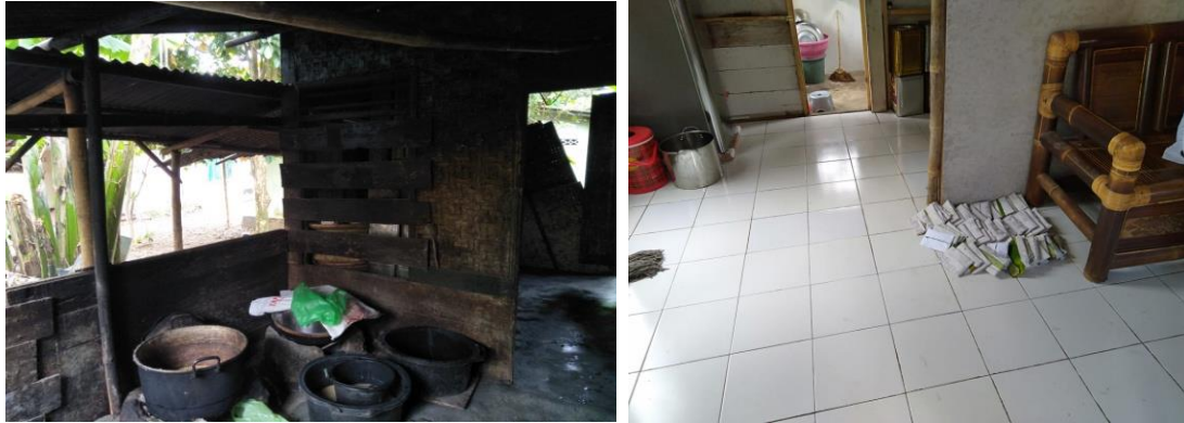
Gambar 4. Kondisi dapur sebelum program (kiri) dan setelah program (kanan)

Selain itu juga terjadi peningkatan efisiensi 25% bahan baku yang digunakan. Secara terperinci terdapat pada tabel 1 berikut ini.