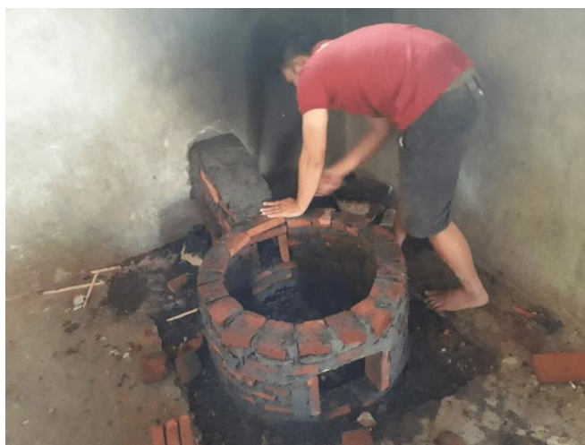
Gambar 2. Pembuatan tungku hemat energi

Setelah selesai dibuat, selanjutnya tungku didiamkan selama 3 hari agar benar-benar kering dan mampu menopang. Selanjutnya, dilakukan pendampingan cara penggunaan tungku tersebut. Pendampingan dilakukan karena terdapat beberapa hal yang berbeda dengan tungku sebelumnya antara lain adalah bahan bakar, lubang tempat memasukkan bahan bakar dan bentuk tungku yang melingkar