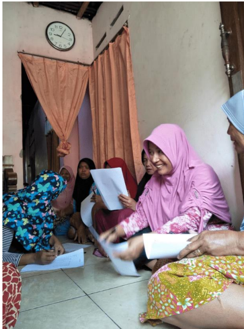
Gambar 1. Pelatihan Cara Pengolahan Pangan yang Baik (CPPB)

Meskipun UKM mitra merupakan UKM yang masih kecil dan belum berkembang, akan tetapi pengetahuan tentang keamanan pangan dan CPPB sangat diperlukan, karena keamanan pangan berlaku tidak hanya untuk usaha bidang pangan dalam skala besar/industri, akan tetapi usaha dengan skala kecil pun harus dapat memberikan jaminan kepada konsumen bahwa produk pangan yang dijual benar-benar aman dan bermutu.