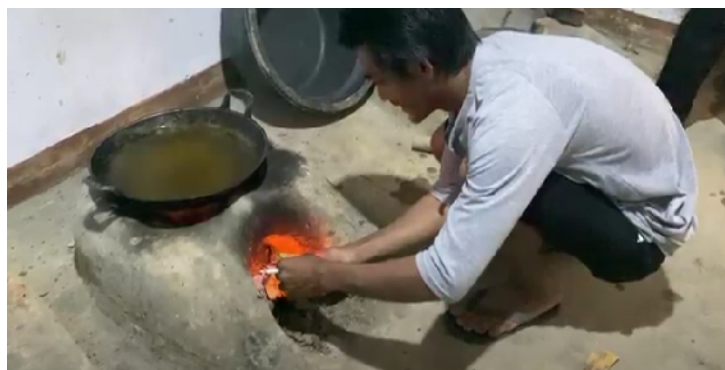
Gambar 2. Proses produksi pembuatan gula aren

Selain melakukan survey, pengrajin gula aren juga memberikan simulasi proses pembuatan gula aren yang biasa dilakukan oleh pengrajin gula aren di Jatigede dapat dilihat pada Gambar 2.