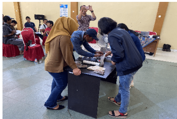
Gambar 6. Peserta melakukan simulasi pengemasan vakum

Para peserta dikenalkan diperkenalkan dengan berbagai variasi kemasan yang sesuai untuk produk gula aren. Selain itu peserta diajak untuk memahami keunggulan dan kelemahan setiap kemasan yang dapat dilihat pada Gambar 5. Selama kegiatan berlangsung, diskusi dari peserta maupun dari pemateri berlangsung interaktif yang ditandai dengan diskusi tanya jawab yang dikemukakan oleh peserta. Tidak hanya disampaikan melalui materi, peserta juga diajarkan untuk merancang label produk dengan cara menggambar dan menulis informasi label yang sesuai dengan peraturan yang berlaku. Peserta juga melakukan simulasi pengemasan dengan vacuum sealer seperti yang terlihat pada Gambar 6.