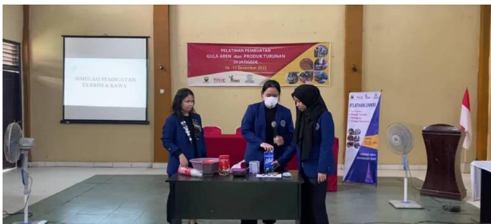
Gambar 7. Pelatihan pengembangan produk turunan gula

Produk lain yang dijelaskan adalah es krim. Para peserta pelatihan dikenalkan cara membuat es krim dengan cara manual menggunakan kaleng dengan bahan dasar susu seperti yang terlihat pada Gambar 7. Setelah es krim selesai dibuat, gula aren yang telah dicairkan dijadikan sebagai topping es krim dan kemudian dibagikan kepada peserta pelatihan untuk dicicip. Selain KAVVA dan es krim yang dijelaskan juga produk lain dari gula aren kepada peserta pelatihan seperti bolu kukus gula aren, ting-ting, nagasari gula aren, wedang serih, fudgy brownies gula aren, dan es cinau susu gula aren (Lingawan dkk., 2019).