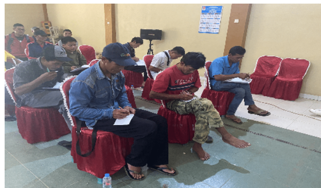
Gambar 4. Peserta melakukan tes sensori

Peserta juga diminta untuk melakukan tes sensori dari beberapa produk contoh yang sudah disiapkan sebelumnya seperti yang terlihat pada Gambar 4. Peserta akan menilai tingkat kesukaan mereka terhadap beberapa produk contoh tersebut. Pada sesi pertama tes sensori yang dilakukan diberikan tiga sampel gula aren cetak kepada peserta yaitu gula aren yang gosong, normal, dan kurang matang. Pada sesi kedua tes sensori yang dilakukan diberikan tiga sampel gula aren semut yang berbeda-beda. Hasil yang didapatkan dari tes sensori yang dilakukan adalah bahwa peserta mengetahui gula aren cetak dan gula aren semut yang layak untuk dijual berdasarkan aroma, rasa, warna, dan teksturnya.