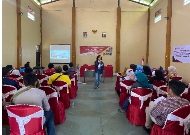
Gambar 5. Pelatihan Label dan Kemasan Produk

Para peserta dikenalkan diperkenalkan dengan berbagai variasi kemasan yang sesuai untuk produk gula aren. Selain itu peserta diajak untuk memahami keunggulan dan kelemahan setiap kemasan yang dapat dilihat pada Gambar 5. Selama kegiatan berlangsung, diskusi dari peserta maupun dari pemateri berlangsung interaktif yang ditandai dengan diskusi tanya jawab yang dikemukakan oleh peserta. Tidak hanya disampaikan melalui materi, peserta juga diajarkan untuk merancang label produk dengan cara menggambar dan menulis informasi label yang sesuai dengan peraturan yang berlaku. Peserta juga melakukan simulasi pengemasan dengan vacuum sealer seperti yang terlihat pada Gambar 6.