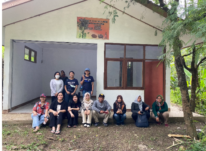
Gambar 1. Survey lokasi pembuatan gula aren

Selain melakukan survey, pengrajin gula aren juga memberikan simulasi proses pembuatan gula aren yang biasa dilakukan oleh pengrajin gula aren di Jatigede dapat dilihat pada Gambar 2.