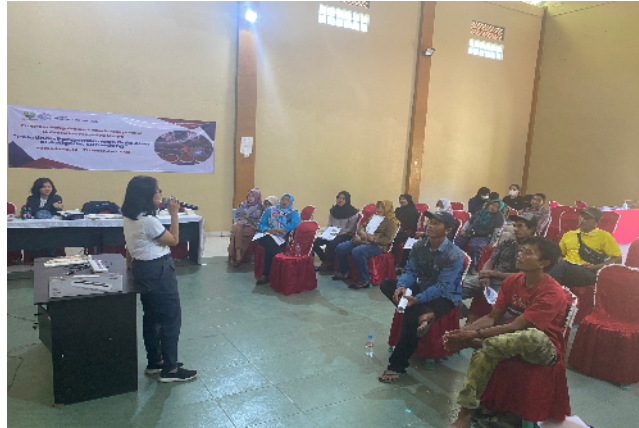
Gambar 3. Pelatihan cara pengolahan pangan yang baik

operasional disebut Industri Rumah Tangga Pangan (IRTP). Pelatihan ini dilakukan pada tanggal 17 Desember 2022 di Desa Cisampih, Jatigede. Adapun peraturan yang mendasari pelatihan ini adalah Peraturan Kepala Badan Pengawas Obat dan Makanan tentang CPPB untuk IRT (BPOM, 2012). Para peserta diberikan pelatihan mengenai bagaimana cara mengolah pangan yang baik dan higienis yang dapat dilihat pada Gambar 3.