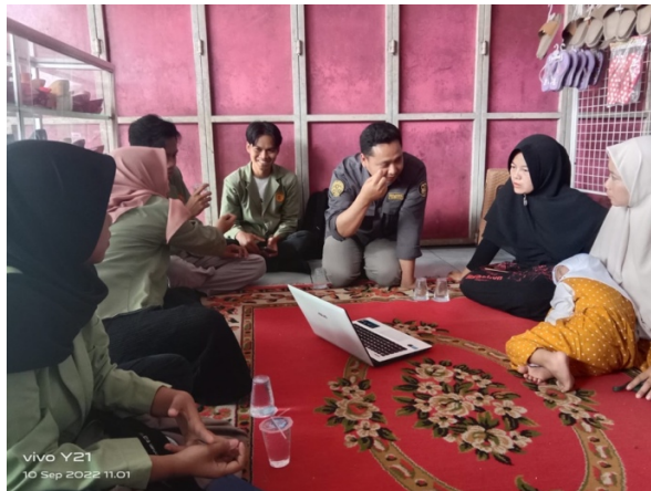
Gambar 3. Sosialisasi manajerial UMKM