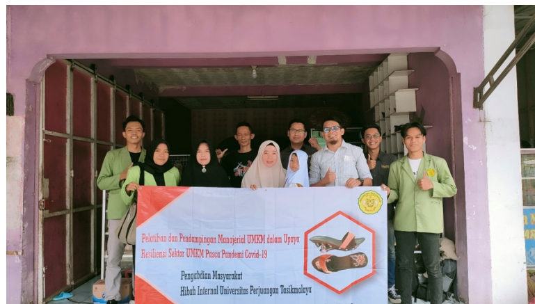
Gambar 6. Sosialisasi Manajerial UMKM