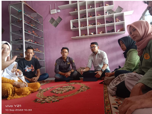
Gambar 2. Sosialisasi manajerial UMKM