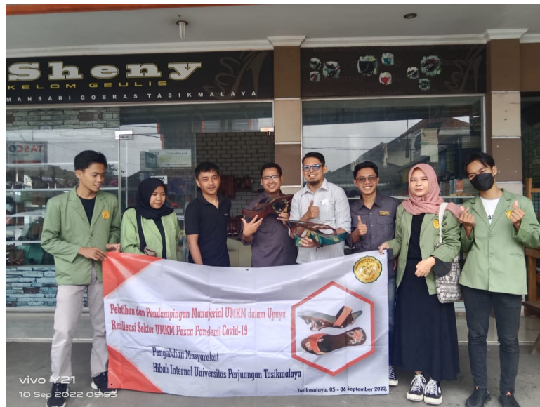
Gambar 5. Sosialisasi manajerial UMKM