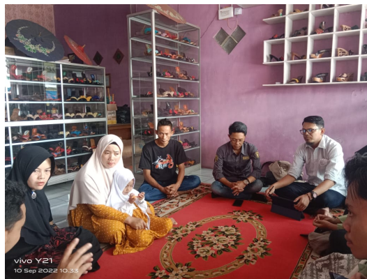
Gambar 1. Sosialisasi manajerial UMKM

Dalam tahap ini diawali dengan Gambar 1, 2, 3, dan 4 yang merupakan kegiatan sosialisasi sekaligus pelatihan penggunaan website, youtube, media sosial dalam promosi produk kelom geulis dan aplikasi pengelolaan laporan keuangan agar para pelaku UMKM tertib dalam mengelola keuangan usahanya.