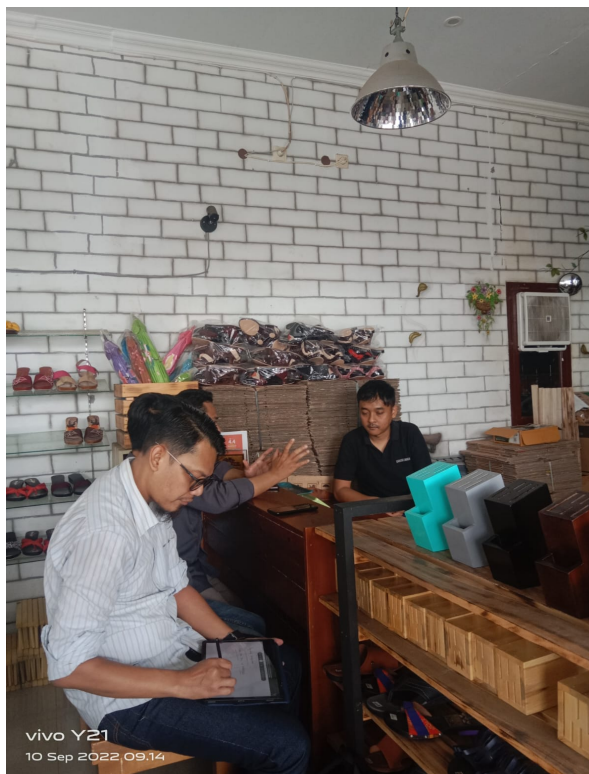
Gambar 4. Sosialisasi manajerial UMKM