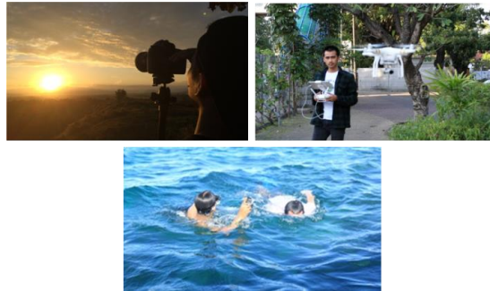
Gambar1.2: Pengambilan gambar menggunakan kamera Dslr, Drone dan GoPro.

Pengambilan gambar dilaksanakan dalam kurun waktu waktu kurang lebih 5 bulan, dimulai pada bulan January sampai Mei. Di lokasi yang telah ditentukan dalam shoot list Pengambilan gambar diikuti oleh scriptwriter (penulis), cameramen, dan talent.