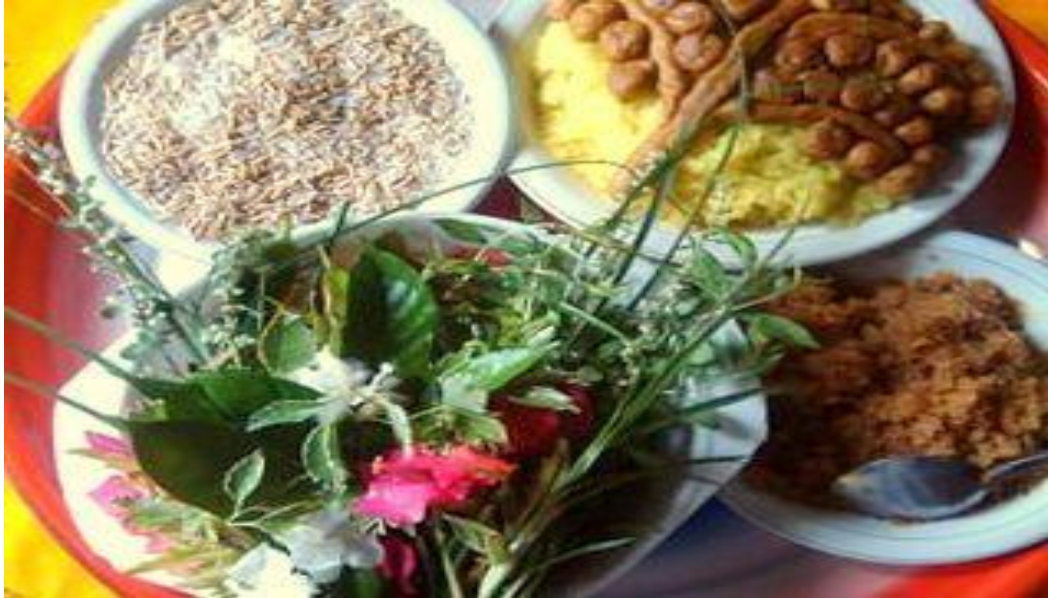
Gambar 2. Perlengkapan peusijuek yang dilakukan masyarakat Aceh