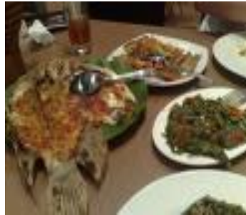
Ikan Bakar Rica-Rica