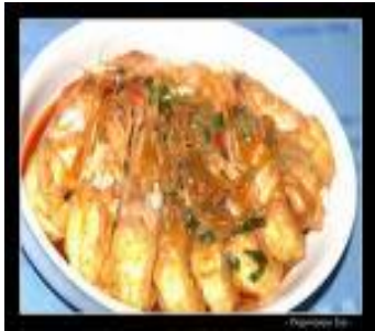
Udang Goreng Mentega