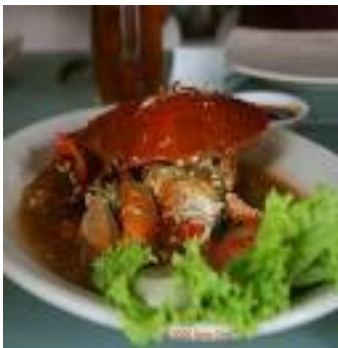
Kepiting lada hitam