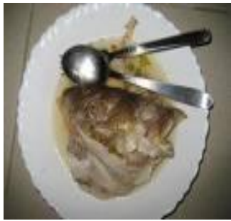
Sop Kepala Ikan