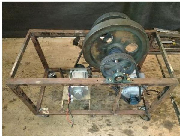
Gambar 2. Rangkaian generator listrik independen

Pembuatan pereduksi energi juga mengalami perubahan dari yang awalnya menggunakan gear sebagai pereduksi energinya kemudian diganti menggunakan v-belt . Alasan penggantianinya karena penggunaan gear dan rantai menimbulkan suara bising dan sering lepas dari jalur rantai, dan juga penggunaan rantai pada putaran cepat berdampak pada keausan gigi pada gear . Alasan lainnya adalah keamanan dari alat itu sendiri karena gear dan rantai akan menimbulkan getaran yang sangat kuat pada alat sehingga diganti dengan v-belt dan pull .