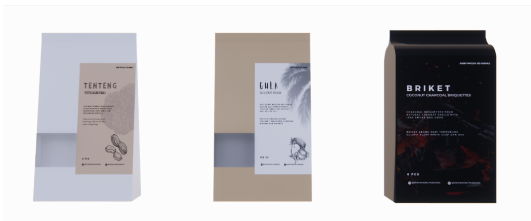
Gambar 2.4. Desain Kemasan Produk