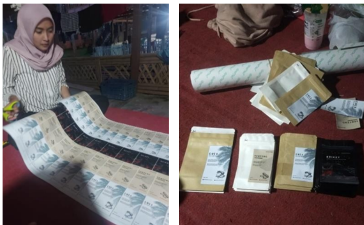
Gambar 2.5. Pembuatan Kemasan

Tahap pembuatan pertama yaitu mencetak stiker kemasan yang telah didesain, kemudian memotong stiker sesuai ukuran kemudian menempelkan stiker pada kemasan. Setelah proses tersebut kemasan telah siap untuk proses selanjutnya yaitu pengemasan. Pada proses pengemasan produk dikemas kemudian disegel menggunakan mesin sealer agar kualitas produk tetap terjaga saat pemasaran.