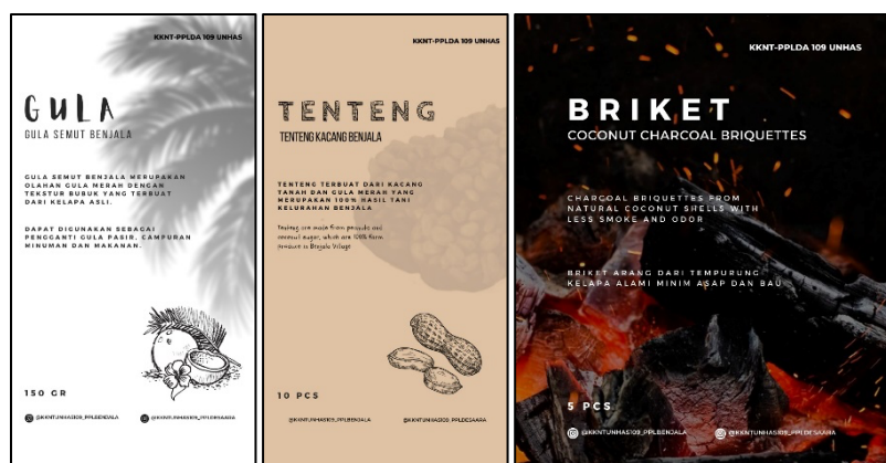
Gambar 2.3. Desain Stiker Kemasan