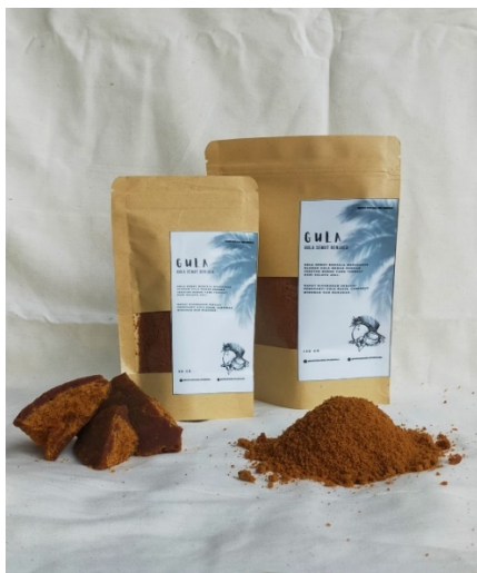
Gambar 3.1. Kemasan Produk Gula Semut

Program kerja KKN dengan kegiatan “Desain Kemasan Produk” dapat dikategorikan berhasil karena telah memenuhi indikator keberhasilan yang telah ditargetkan yakni terciptanya desain kemasan untuk tiga produk inovasi yang telah dikembangkan oleh mahasiswa KKNT Pengembangan Produk Lokal Masyarakat Kecamatan Bontobahari Posko Benjala.