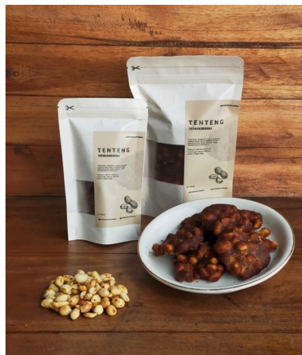
Gambar 3.2. Kemasan Produk Tenteng Kacang