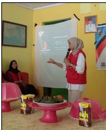
Gambar 2.6. Presentasi Desain Kemasan

Desain yang telah dibuat kemudian dipresentasikan kepada masyarakat, tokoh-tokoh masyarakat dan pejabat pemerintah di Kelurahan Benjala melalui program kelompok yaitu sosialisasi hasil pengembangan produk dan program kerja yang dilaksanakan di Kantor Kelurahan Benjala. Dalam forum ini penulis menjelaskan fungsi dan pentingnya kemasan suatu produk dan menjelaskan detail-detail desain kemasan seperti pemilihan material, warna, font, dan informasi yang harus terdapat pada kemasan.