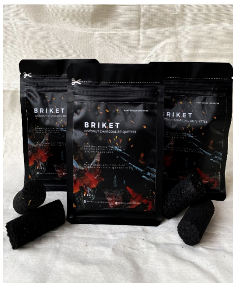
Gambar 3.3. Kemasan Produk Briket