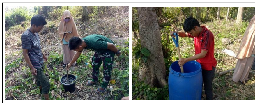
Gambar 4. Proses pembuatan kompos.

Penerapan sistem integrasi tanaman ternak setelah melakukan pengukuran langsung dilapangan diperoleh hasil yang cukup menjanjikan. Potensi kompos yang dapat dihasilkan oleh petani Mitra dari limbah feces ternak dan sisa pakan ternak sebanyak 2,5 kg setiap 2 ekor kambing sehingga dalam setahun petani Mitra dapat menghasilkan 912,5 kg kompos. Dengan demikian petani dapat menghemat/menekan penggunaan pupuk kimia. Kariyasa (2017) mengemukakan bahwa penggunaan pupuk kandang (organik) pada sistem integrasi tanaman ternak telah terbukti mampu meningkatkan produktivitas dan pendapatan petani, serta mengurangi biaya produksi. Selain itu petani