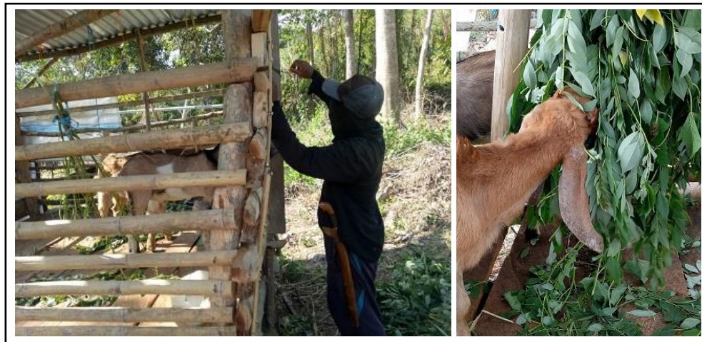
Gambar 6. Pemberian pakan pada ternak kambing.