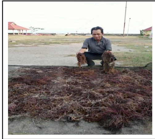
Gambar 1. Proses Penanganan Rumput Laut

Berdasarkan justifikasi di atas untuk meningkatkan pengetahuan mitra tentang rumput laut Eucheuma cottonii maka tim pengusul akan melaksanakan :