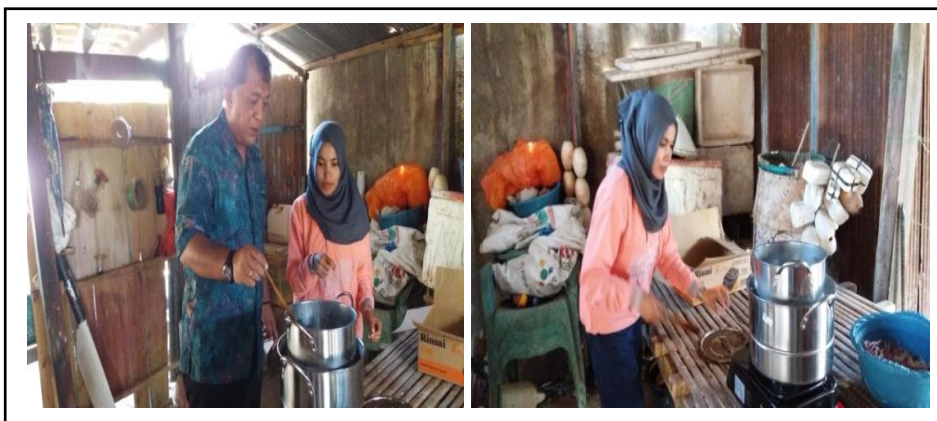
Gambar 3. Pelatihan dan Pendampingan Ekstraksi Rumput Laut Eucheuma cottonii di Kabupaten Jeneponto.

pembuatan pengharum ruangan dari limbah padat rumput laut menjadi produk olahan dapat meningkatkan kesejahteraan ekonomi petani didesa Pabiringan kecamatan Binamu kabupaten Jeneponto.