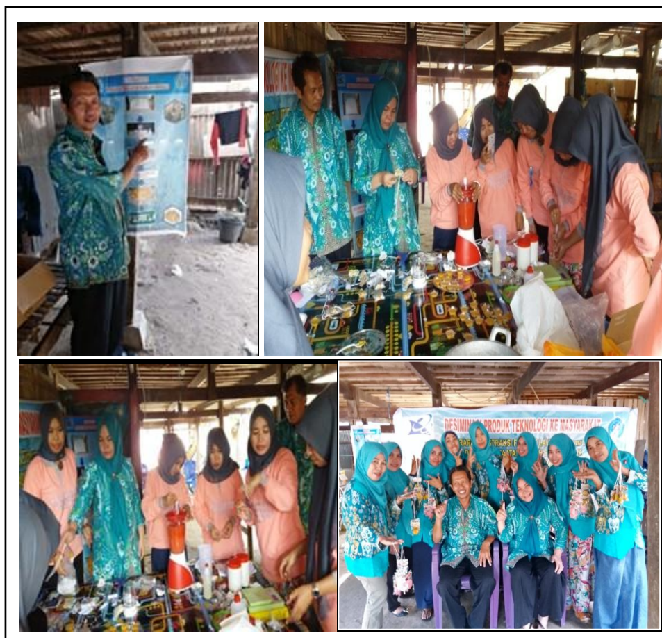
Gambar 4. Diseminasi Teknologi Pengharum Ruangan Rumput Laut di Kabupaten Jeneponto

Diseminasi produk teknologi ke masyarakat dengan penerapan ekstraksi rumput Laut ( Eucheuma cottonii ) dan pemanfaatan limbah padat untuk pembuatan pengharum ruangan minimalis di Kabupaten Jeneponto berfungsi untuk membekali ilmu pengetahuan masyarakat sehingga dapat mengolah rumput laut. Dimana jika dilakukan secara rutin akan terbentuk industri kreatif yang mengembangkan usaha rumput laut. Harapan kedepannya dapat dimanfaatkan dalam aktivitas ekonomi daerah dalam upaya peningkatan produk unggulan dan daya saing.