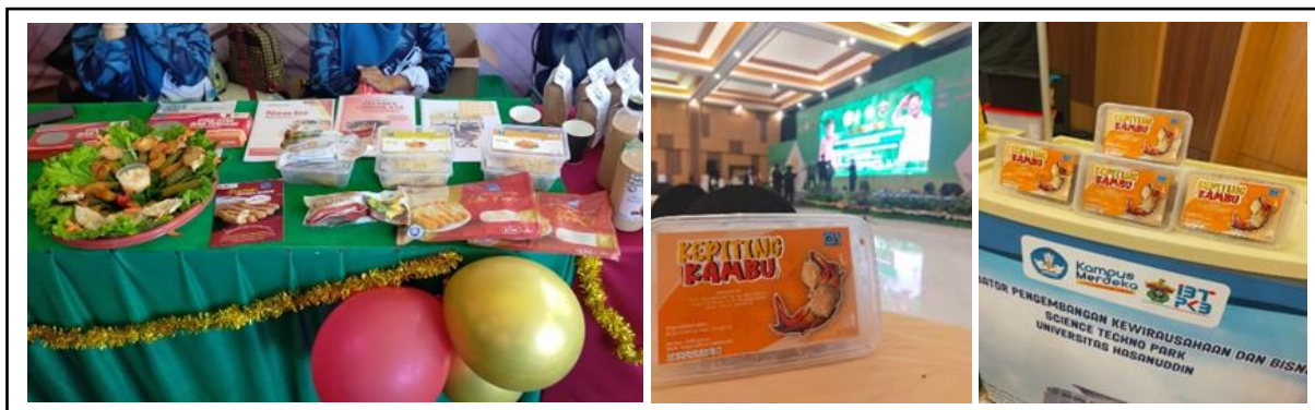
Gambar 9. Kegiatan Pameran Produk.

rumah produksi KUB Salemo. Sehingga untuk pemesanan, produk setelah dibuat harus segera didistribusikan ke konsumen.