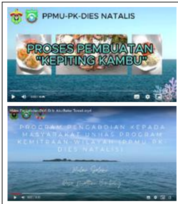
Gambar 7. Video Pembuatan Kepiting Kambu dan Video Pelaksanaan Kegiatan.