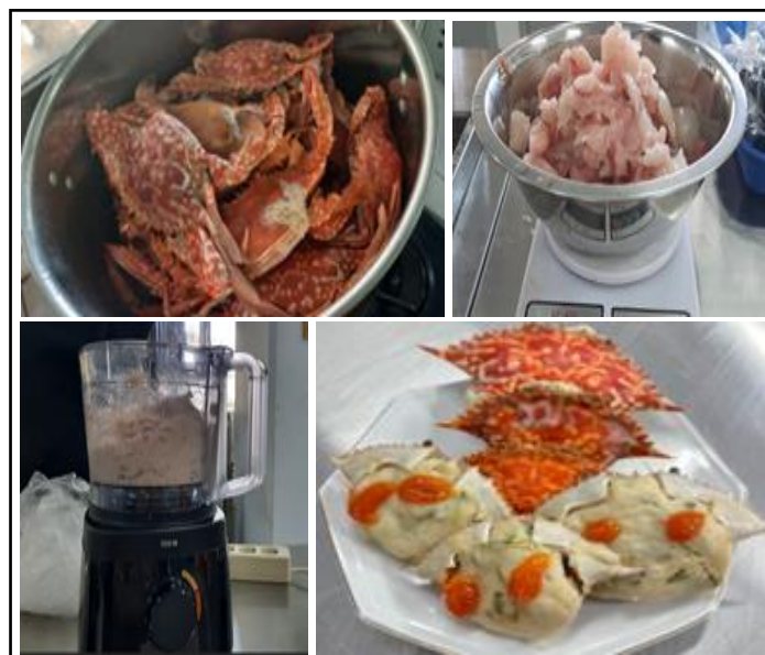
Gambar 3. Pembuatan Kepiting Kambu Isian Otak-Otak Skala Laboratorium.