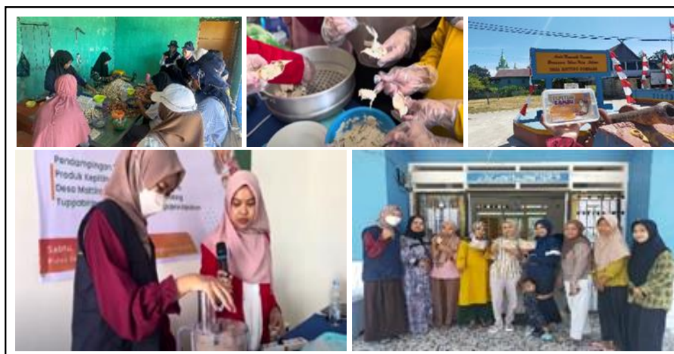
Gambar 5. Pelatihan Pembuatan Kepiting Kambu Isian Otak-Otak.