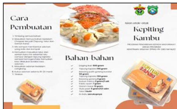
Gambar 2. Leaflet.

Persiapan teknologi dengan inovasi berupa isian otak-otak sebagai varian baru pada produk kepiting kambu di skala laboratorium merupakan kegiatan yang dilakukan untuk persiapan sebelum turun langsung ke lokasi pengabdian. Adapun tahapan pembuatannya dapat dilihat pada Gambar 3.