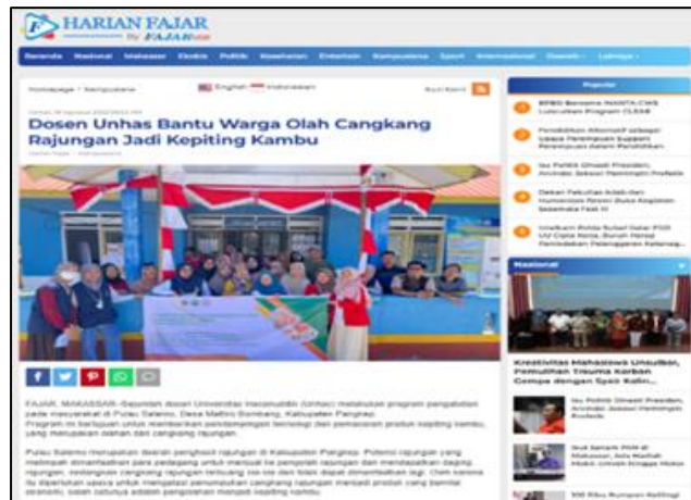
Gambar 6. Publikasi media masa online pada Harian Fajar.