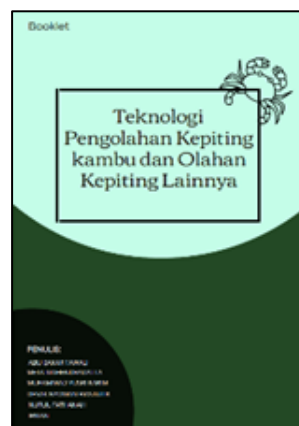
Gambar 1. Booklet.

Booklet pada kegiatan ini digunakan sebagai buku saku yang berisikan berbagai informasi terkait teknologi pengolahan kepiting dan olahan kepiting lainnya, seperti pada Gambar 1. Kemudian memberikan informasi kepada masyarakat mengenai teknologi terbaru dalam pengolahan kepiting dan olahan produk kepiting. Dengan adanya booklet ini akan membantu meningkatkan pengetahuan masyarakat tentang cara mengolah kepiting dengan benar, meningkatkan kualitas produk, dan potensi pengembangan usaha.