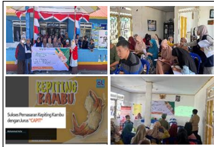
Gambar 4. Kegiatan Sosialisasi.

agar nantinya dapat dibuat sendiri oleh peserta pengabdian setelah dilaksanakan kegiatan ini (Gambar 5). Setelah proses mengadon, selanjutnya dilakukan proses memasukkan adonan ke dalam cangkang kepiting rajungan yang telah disiapkan kemudian dikukus. Kepiting kambu yang telah matang selanjutnya dikemas dengan menggunakan kemasan box plastik dan diberi label hingga siap untuk dipasarkan.