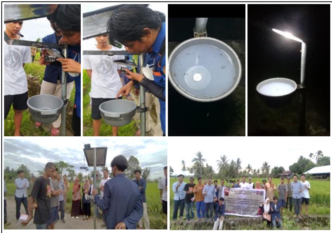
Gambar 4. Pelatihan dan Perakitan serta Pemasangan Alat Light trap .

berbasis energi surya. Pada kegiatan pelatihan ini juga dilakukan pengambilan data awal berupa jumlah tangkapan hama serangga oleh alat perangkap light trap yang dirancang (Gambar 4).