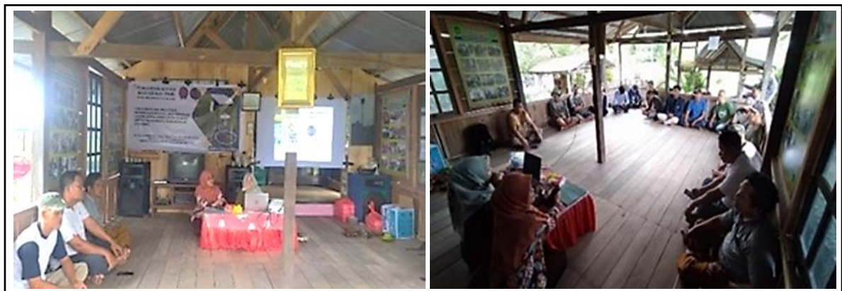
Gambar 3. Sosialisasi dan Pemberian Materi Pelatihan.

nannya secara organik yaitu salah satunya dengan pemanfaatan light trap . Kegiatan sosialisasi dihadiri oleh kelompok tani sebanyak 25 orang yang tergabung dalam Kelompok Tani Sipatuo Deceng. Selain itu dihadiri pula oleh kepala Desa Carawali dan penyuluh pertanian. Kegiatan pelatihan ini mendapat apresiasi yang positif dari pemerintah desa dan masyarakat sangat mengapresiasi adanya kegiatan pengabdian ini.