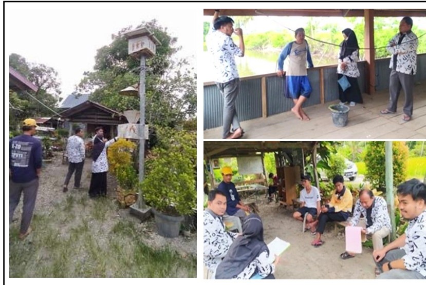
Gambar 2. Kegiatan Observasi dan Survey Lokasi.