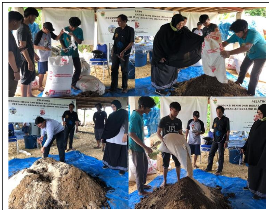
Gambar 4. Praktek pembuatan Kompos