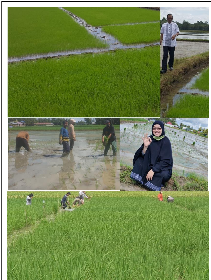
Gambar 6. Demplot perbenihan padi hitam.