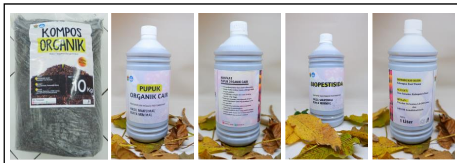
Gambar 8. Produk Kompos, POC dan Biopestisida yang telah dikemas.