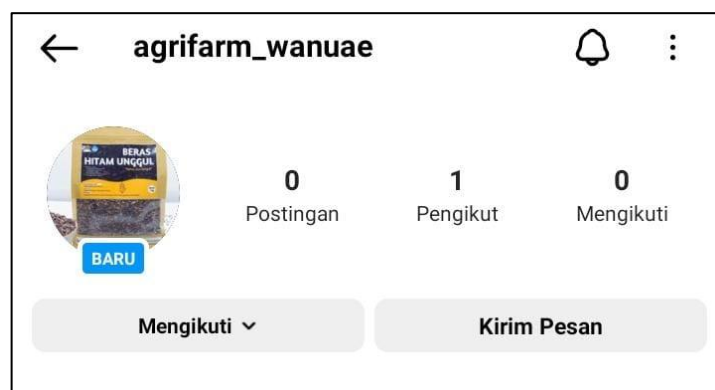
Gambar 9. Akun Instagram untuk pemasaran produk beras hitam secara online.