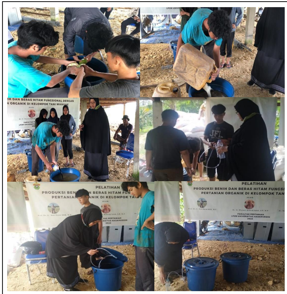
Gambar 5. Praktek pembuatan POC dan Biopestisida