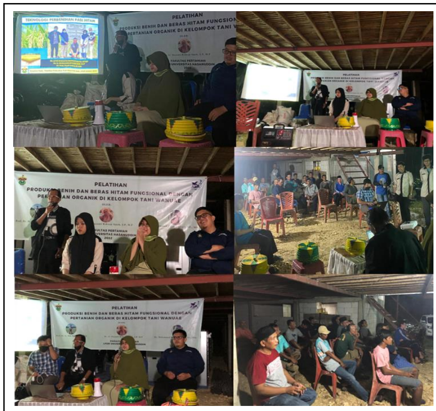
Gambar 3. Pelatihan perbenihan, pembuatan pupuk kompos, POC dan Biopestisida.

Ifayanti Ridwan, Muh. Farid BDR, dan Muhammad Fuad Anshor: Implementasi Pertanian Organik Pada Produksi Benih dan Beras Hitam Fungsional di Kelompok Tani Wanue.