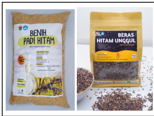
Gambar 7. Produk benih (kiri) dan beras hitam fungsional (kanan) yang dihasilkan oleh Kelompok Tani Wanuae.

Selain pendampingan pada kegiatan pengemasan dan pemberian label, petani juga dilatih dalam membuat akun media sosial (Gambar 9) sebagai wadah untuk memasarkan produk-produk luaran dari kegiatan ini yakni benih dan beras hitam serta produk pupuk organik (kompos, POC dan biopestisida).