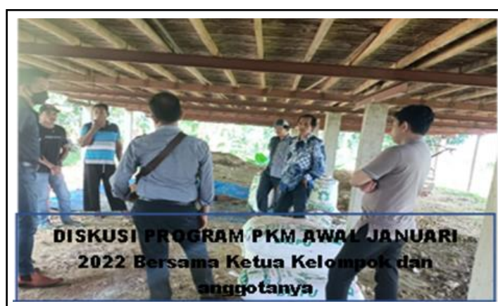
Gambar 2. Sosialisasi Program PKM dengan Kelompok Tani Mitra.

kelompok tani mitra juga diminta untuk memberikan masukan kepada tim tentang hal-hal yang dibutuhkan dalam transfer ilmu pengetahuan dan topik serta aspek yang masih kurang dipahami. Dari kegiatan ini kemudian disepakati jadwal dan lokasi pelaksanaan kegiatan pelatihan, demplot dan pendampingan (Gambar 2).