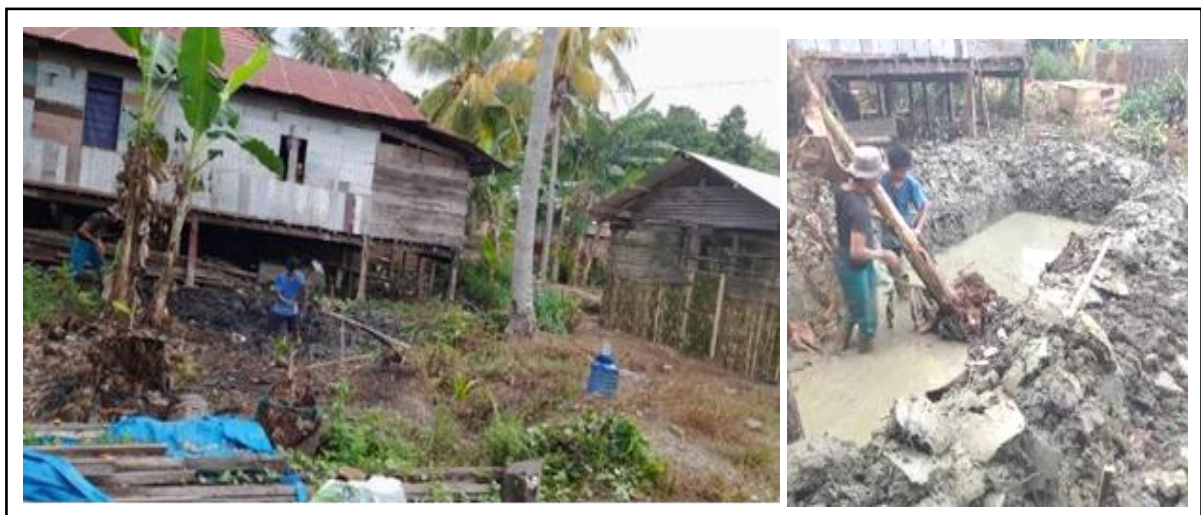
Gambar 6. Pembuatan Kolam Ternak Itik.