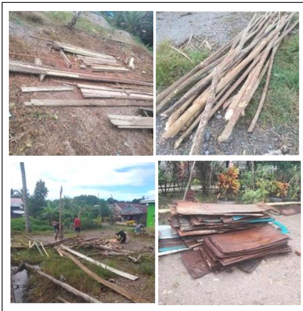
Gambar 4. Persiapan Bahan Bagunan Kandang dan Pagar Pembatas.