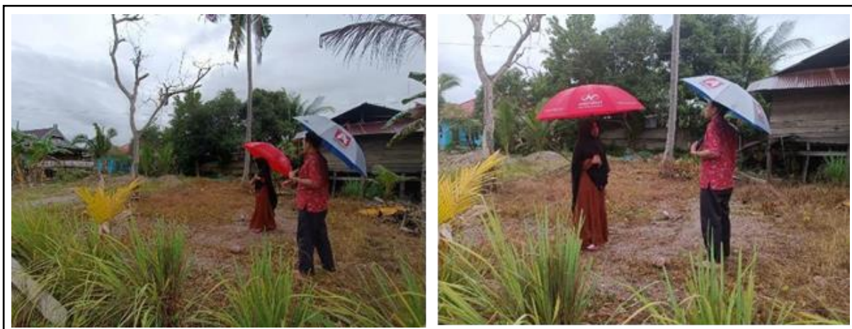
Gambar 3. Survei Lokasi Pembangunan Kandang Pemeliharaan Ternak Itik.