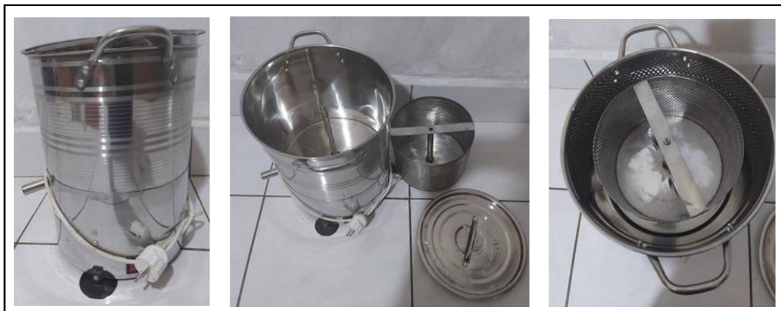
Gambar 9. Mesin Spinner (Alat Peniris Minyak Abon).

kelompok yang bernilai ekonomi. Pada kegiatan ini dilakukan penjelasan materi dan pelatihan secara langsung terkait materi yang diberikan. Adapun materi yang diberikan berupa bagaimana peningkatan ekonomi skala rumah tangga dan kelompok masyarakat, pembuatan kandang, pembuatan olahan, pengenalan alat dan bahan yang digunakan (Gambar 9, Gambar 10, dan Gambar 11).