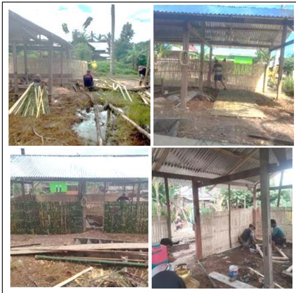
Gambar 5. Proses Pembangunan Kandang Pemeliharaan Ternak Itik.