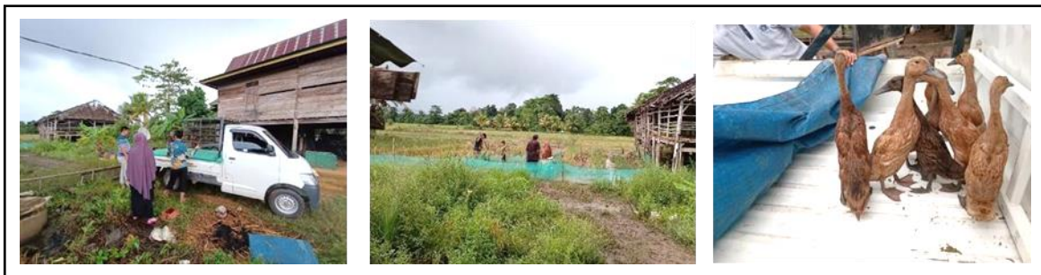
Gambar 7. Pengangkutan Ternak Itik dari Produsen/Peternak Itik.

ini dilakukan dikarenakan ternak Itik membutuhkan perhatian khusus setiap hari, baik proses pemberian pakan yang dilakukan setiap hari sebanyak dua kali (pagi dan sore hari), pemberian air minum secara ad libitum . Kegiatan lain yang dilakukan selanjutnya adalah kegitan penyuluhan dan pengolahan produk asal ikan.