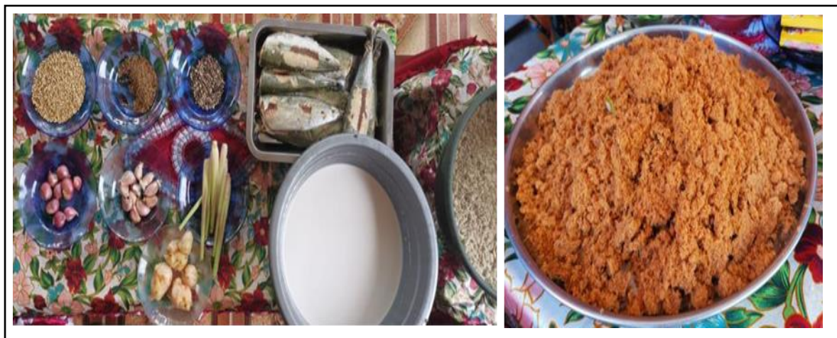
Gambar 10. Bahan dan Produk Abon Bernilai Ekonomi.