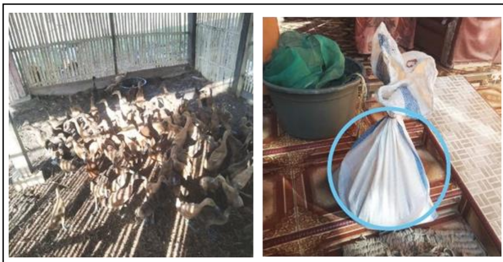
Gambar 8. Pemantauan Perkembangan Pemeliharaan dan Pertumbuhan Ternak Itik.