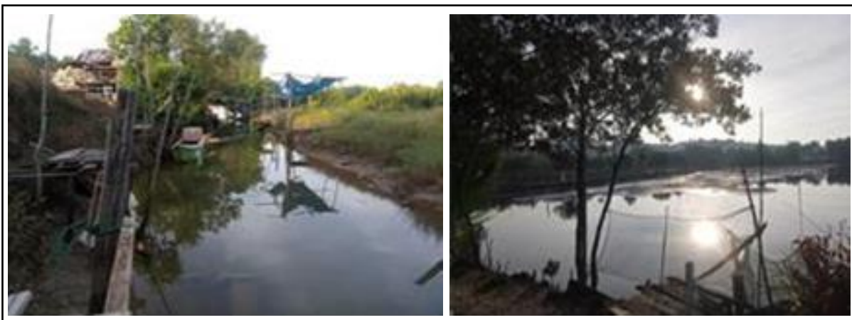
Gambar 2. Lahan Empang yang Kurang Termanfaatkan.

Pada umumnya di Desa Lawulo masyarakat berprofesi nelayan dan petani, hanya saja untuk saat ini masih kurang produktif dan cenderung tidak aktif dikarenakan sistem manajemen kelompok yang masih belum optimal, kurangnya kegiatan pelatihan yang diperoleh anggota kelompok sehingga tidak menambah skill baru guna mendukung dan mengembangkan kegiatan kelompok, kurangnya pemanfaatan potensi lokal wilayah pesisir dan pertanian yang diterapkan (Gambar 2).