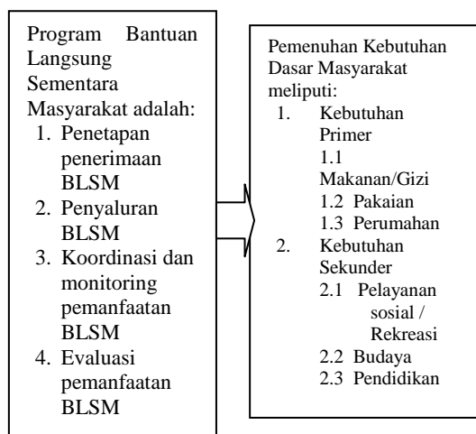
Gambar 2.1 Kerangka Pemikiran