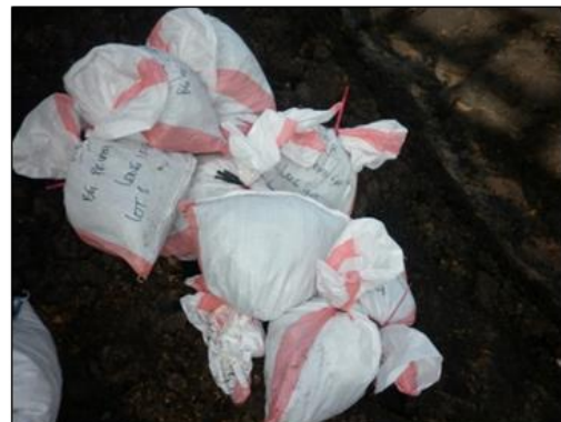
Gambar 4. Pengambilan sampel batubara pada ship loading .