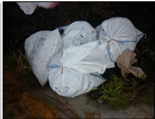
Gambar 3. Pengambilan sampel batubara pada front penambangan.