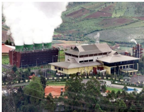
(a) Cerobong & uap air

Ada beberapa model fisika dan rekayasa air laut agar bisa menguap dan naik ke udara bebas dengan memanfaatkan potensi panas bumi yang dekat dengan pantai atau laut, merupakan potensi yang ideal. Karena, jika meninjau pusat listrik tenaga panas bumi yang sekarang sudah beroperasi selain menghasilkan tenaga Listrik, juga menghasilkan uap air sebagai limbahnya yang naik ke udara bebas, namun tidak mengandung Aerosol sebagai CCN. Sehingga uap air tersebut sekalipun mencapai CCL dan LCL tidak akan terbentuk awan. Tanpa Aerosol yang bertindak sebagai CCN maka awan tidak akan terbentuk. Terpikir oleh tim rekayasa awan buatan ini, bagaimana kalo di sekitar cerobong uap air PLTP dilakukan pembakaran flare atau penambahan/penyemaian CCN (1)? Hal ini merupakan ide dan kajian yang berbeda, karena potensi uap air yang keluar dari cerobong secara terus menerus (non-stop) selama operasi PLTP tersebut sepertinya sia-sia saja terbuang percuma, padahal merupakan potensi bahan baku pembentuk awan dan hujan di daerah PLTP berada, seperti pada Gambar 1 bisa dimanfaatkan, sementara pada musim kemarau atau kekeringan sulit terbentuk awan secara alami.