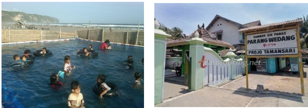
Gambar 3. Kolam air laut dan sumber air panas alami yang mengandung garam laut