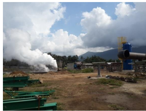
(b) Uap air dan awan