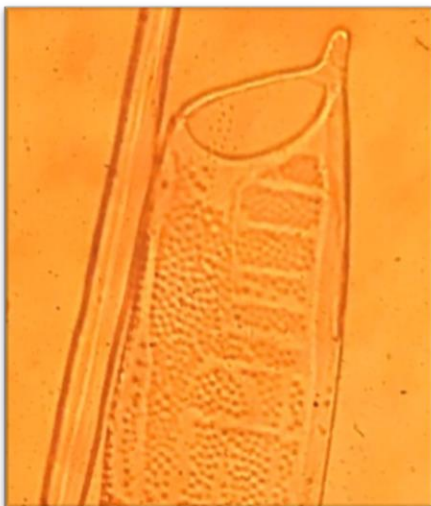
Gambar 4. Bidang perforasi bentuk tangga jabon merah provenans Wajo (perbesaran 10x).

Gambar 4 menunjukkan bidang perforasi kayu jabon merah provenans Wajo yaitu berbentuk tangga. Bidang perforasi berbentuk tangga oleh IAWA dijelaskan seperti berbentuk lubang memanjang kesamping dan tersusun bertingkat ke bawah seperti tangga (Sulistyobudi et al. , 2008).