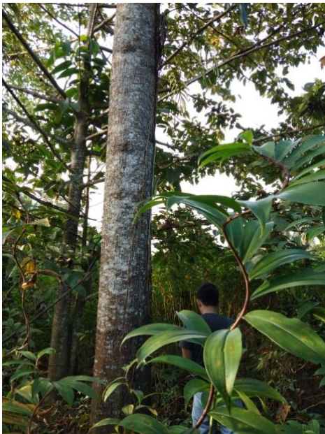
Gambar 2. Kondisi pohon penelitian

Preparat maserasi dibuat melalui perendaman contoh kayu dengan campuran antara asam asetat glacial dan hidrogen peroksida (1:1) dan dilanjutkan dengan perebusan selama 24 jam. Selanjutnya, filtrat dibuang dan sampel dicuci dengan aquades sampai bebas asam. Setelah itu, sampel dikocok sampai serat terlepas dengan sempurna lalu diberi pewarna safranin 2% selama 24 jam. Terakhir, sampel dicuci dengan alkohol bertingkat 30%, 50%, 70%, 90% dan aquades.