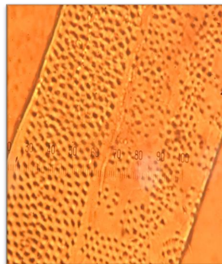
Gambar 3. Bentuk noktah antar pembuluh selang-seling bentuk poligonal jabon merah provenansi Wajo (perbesaran 40x).

Noktah merupakan celah dalam dinding sel. Celah ini berupa saluran terbuka menuju rongga sel (lumen) dan memiliki selaput yang menutup ujung saluran pada bagian luar dinding sel (Panshin & de Zeeuw, 1980).