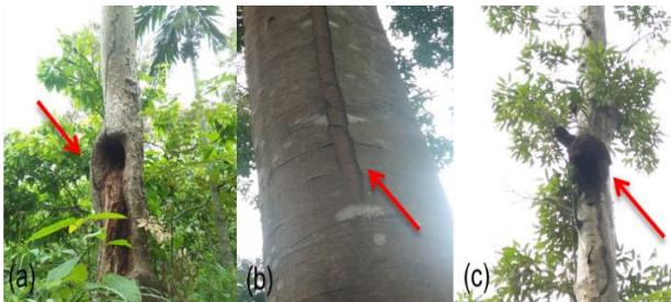
Gambar 3. Tipe kerusakan: gerowong (a), luka terbuka (b), dan rumah rayap (c)

Tipe kerusakan pohon yang ditemui di lokasi penelitian antara lain adalah gerowong, luka terbuka dan rumah rayap. Tipe kerusakan pohon yang ditemui di lokasi penelitian disajikan pada Gambar 3.