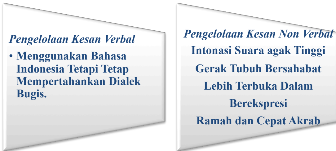
Gambar 3 : Pengelolaan Kesan Verbal

Uraian secara rinci mengenai pengkategorian hasil penelitian tersebut, dapat di lihat pada gambar 3, berikut mengenai pengelolaan kesan verbal etnik Bugis dalam berinteraksi dengan budaya Sunda, yakni :