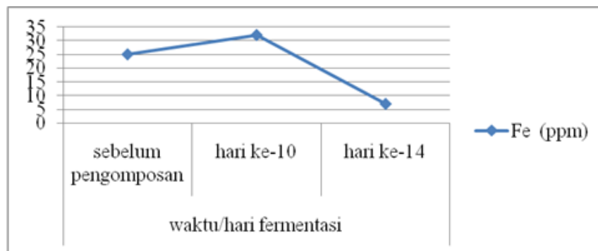
Gambar 1. Nilai Fe Sebelum dan Setelah Pengomposan

Tabel 1 menunjukkan bahwa temperatur sebelum pengomposan yaitu 20 0 C dengan pH awal 4,28, sedangkan pada pengomposan hari ke-10 dan 14 yaitu