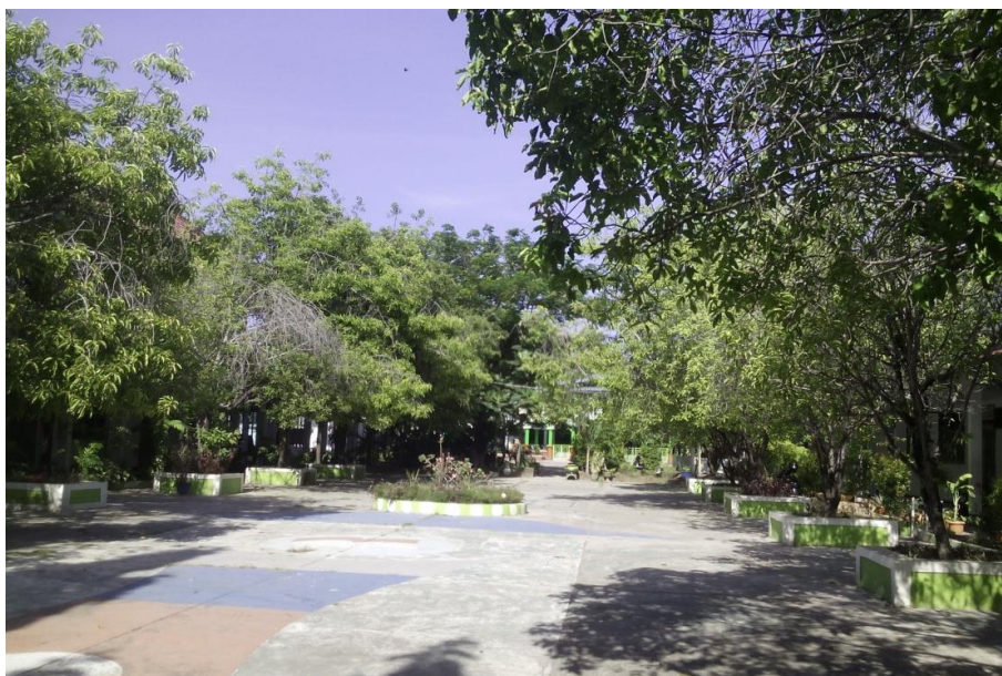
Gambar 3. Ruang Terbuka Hijau di Lingkungan SMAN 17 Makassar.

bukanlah menjadi masalah apabila sampah organik tersebut bisa diolah menjadi kompos untuk digunakan kembali memupuk tanaman yang ada dalam lingkungan sekolah.