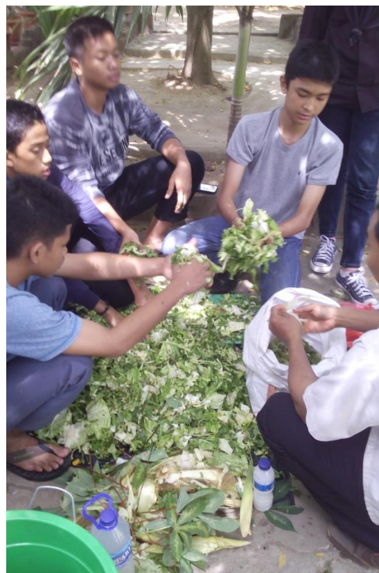
Gambar 4. Pelatihan Pembuatan Kompos dari Sampah Organik.

Suasana lingkungan sekolah yang teduh akan memberi efek kenyamanan bagi siswa dan guru. Yanti, et.al. , (2017) mengemukakan bahwa taman sekolah yang tertata dengan rapi, bersih, dan indah akan memberi dampak positif dalam proses belajar mengajar dari siswa dan gurunya. Tanaman yang sudah ada di lingkungan sekolah haruslah dipelihara dengan baik dan benar sehingga pertumbuhannya bagus. Selain itu, peletakan dari setiap tanaman harus memenuhi kaidah fungsional dan estetik sehingga menghasilkan lingkungan taman sekolah yang asri. Yanti, et.al. , (2017) mengungkapkan bahwa dalam penataan taman sekolah, hal penting yang perlu