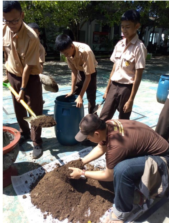
Gambar 5. Kompos yang Dihasilkan dan Digunakan Sebagai Campuran Media Tanam

Demplot untuk pelatihan penataan taman sekolah berupa satu bagian taman kecil di tengah lapangan. Taman ini sebenarnya merupakan focal point ketika kita memasuki area sekolah bagian dalam. Namun taman ini nampaknya kurang terpelihara dengan baik sehingga banyak ditumbuhi gulma. Melalui kegiatan pelatihan ini, siswa dan guru diajak bersama-sama melakukan renovasi taman dan dengan penuh antusias mereka terlibat dalam kegiatan tersebut (Gambar 6). Pada penataan taman ini sedapat mungkin tetap memanfaatkan tanaman-tanaman yang sudah ada dan hanya menambahkan satu