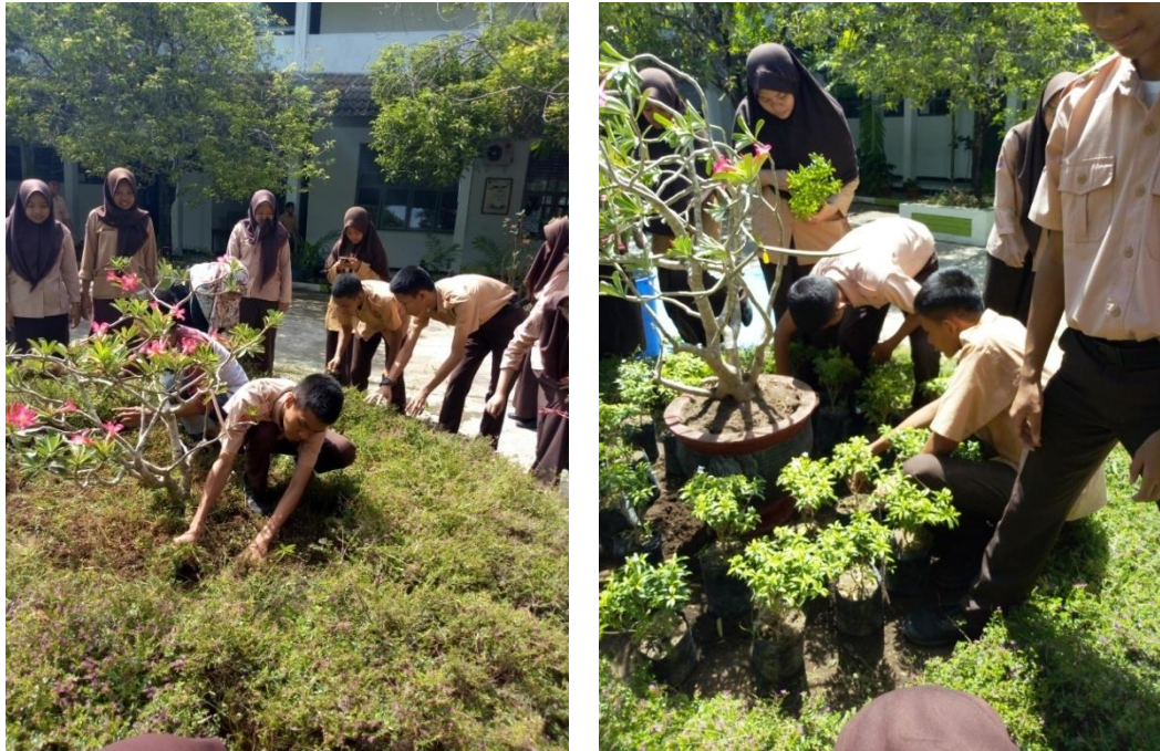
Gambar 6. Pelatihan Penataan Taman