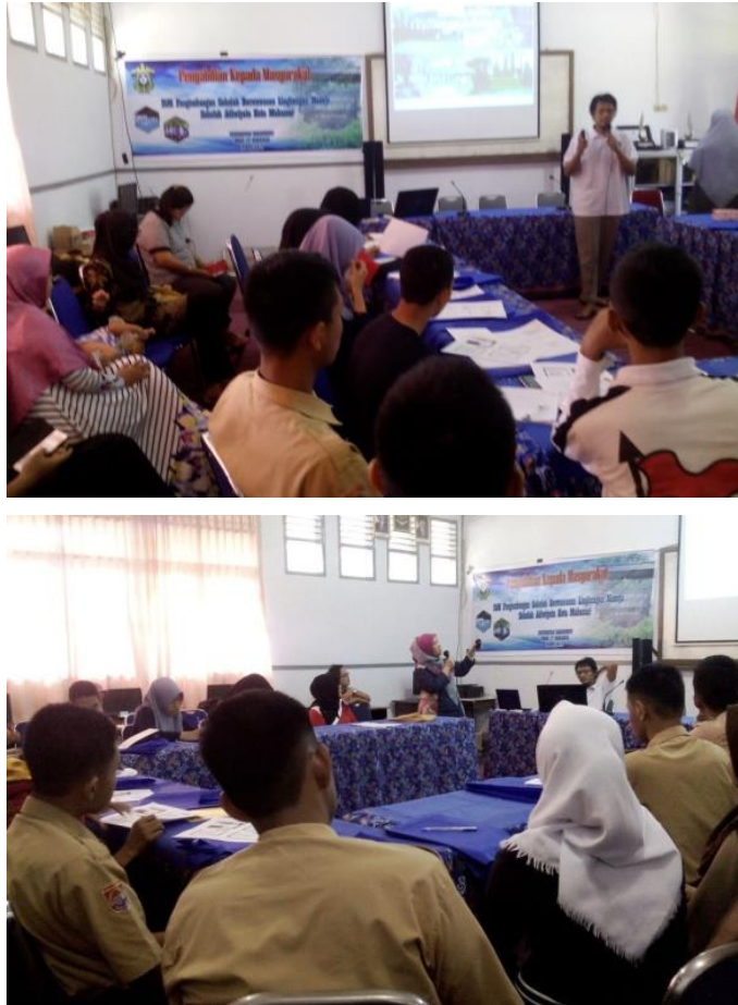
Gambar 1. Pemaparan Materi Dalam Kegiatan Penyuluhan.

Pada tahap awal kegiatan, diberikan pemaparan materi dalam bentuk penyuluhan kepada mitra yaitu civitas SMAN 17 Makassar seperti nampak pada Gambar 1 sebagai berikut