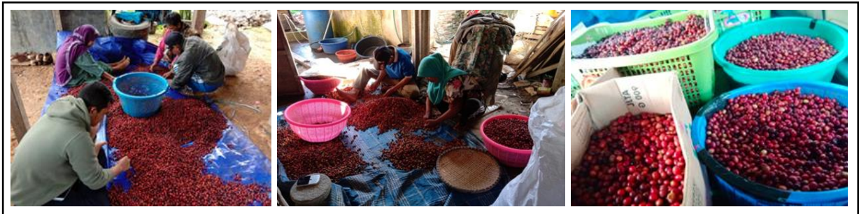
Gambar. 3 Teknik sortasi biji kopi arabika.

Tahapan selanjutnya dalam kegiatan pelatihan ini adalah proses pascapanen yaitu pengupasan kulit buah kopi atau pulping yang bertujuan untuk memisahkan kulit buah kopi dengan biji kopi gabah yang berlendir (Gambar 4). Kemudian dilanjutkan dengan proses fermentasi biji kopi yang bertujuan untuk melunakkan sisa lapisan lender yang melempel pada permukaan kulit tanduk biji kopi oleh mikroba atau enzim, baik secara alami yang ada di lender biji kopi tersebut atau menggunakan starter mikroba buatan. Selain itu tujuan fermentasi adalah mengurangi rasa pahit dan mendorong terbentuknya aroma atau kesan "mild" pada citarasa seduhan kopi arabika. Waktu fermentasi yang dilakukan adalah 12 jam sampai 24 jam, setelah fermentasi selesai maka dilanjutkan dengan proses pencucian. Pencucian berfungsi untuk menghilangkan sisa lender dari hasil fermentasi yang menempel dikulit