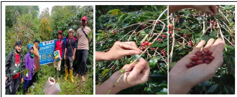
Gambar 2. Teknik panen buah kopi arabika.

Kegiatan sortasi buah kopi adalah tahapan yang terpenting sebelum buah kopi diolah, sortasi terlebih dahulu dilakukan, untuk memisahkan biji hijau, buah kuningan, buah yang hitam yang ikut terpetik. Sortasi juga dilakukan dengan memisahkan dari ranting, daun, dan kotoran lain yang