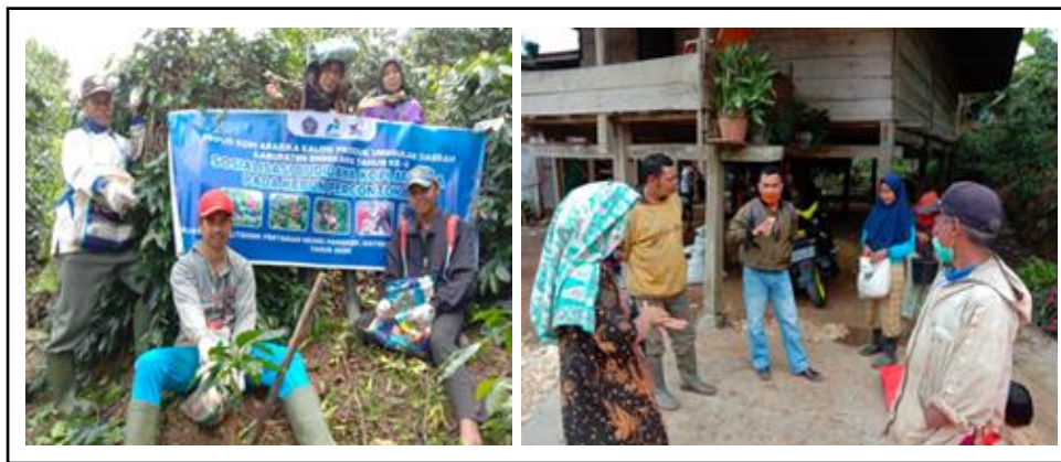
Gambar 1. Kegiatan penyuluhan teknik panen buah kopi.

karakteristik aroma yang berbeda. Teknik panen dan pascapanen yang diketahui oleh kelompok mitra hanya sebatas panen langsung jemur. Namun, setelah mengikuti kegiatan ini, peserta telah mengetahui teknik panen dan pascapanen terutama dalam hal cara pemetikan buah kopi yang benar, proses sortasi buah dan pascapanen buah kopi lainnya.